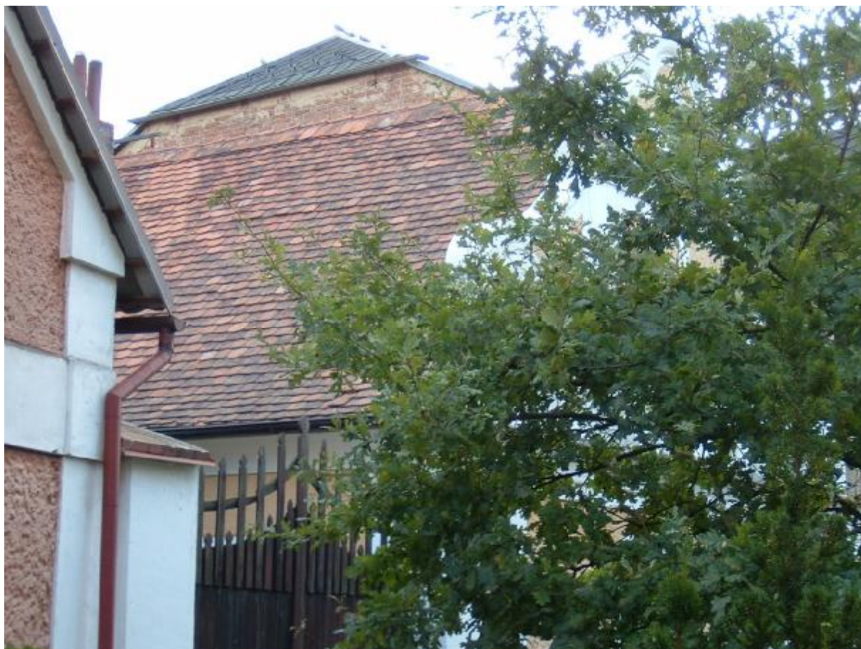
Čp. 52 Žižkovo náměstí – stav střechy

Předpokládané náklady na obnovu střechy jsou ve výši 400 000,- Kč.