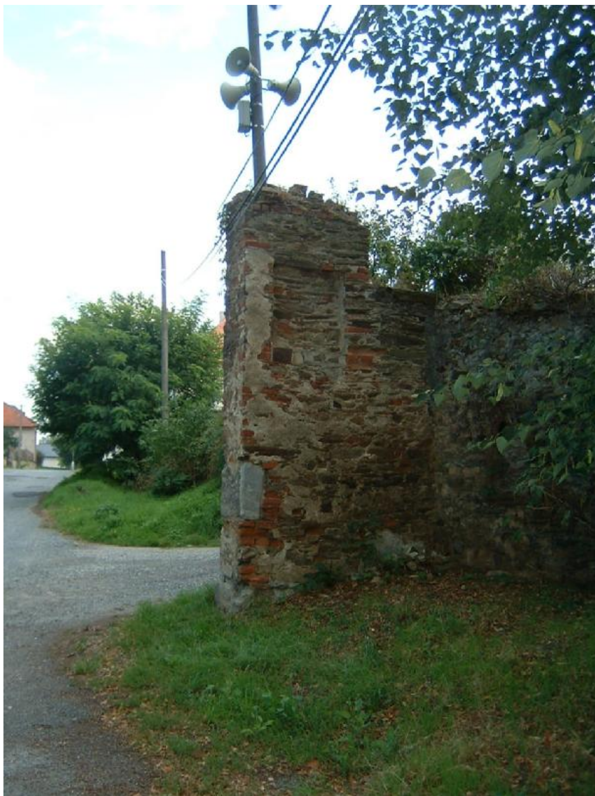
Vstupní brána do obce (detail – pravý pilíř)