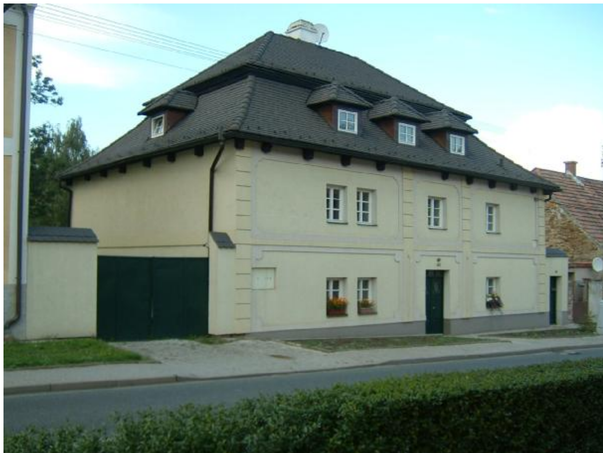
Dům čp. 100 (pohled z ulice)

Dříve neobydlený dům prošel celkovou rekonstrukcí a v současné době je celoročně užíván.