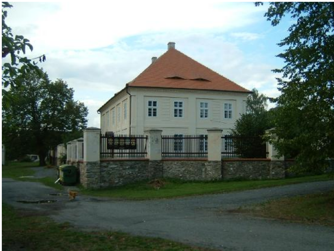
Budova zámku čp. 1

Součástí areálu kulturní památky zámku je rovněž krytá studna (altán). Stavba je umístěna mezi vzrostlými stromy ve dvoře, je to přízemní stavba kruhového půdorysu krytá kopulovou střechou krytou původně štípaným dřevěným šindelem, který je dnes provizorně překryt bitumenovým šindelem.