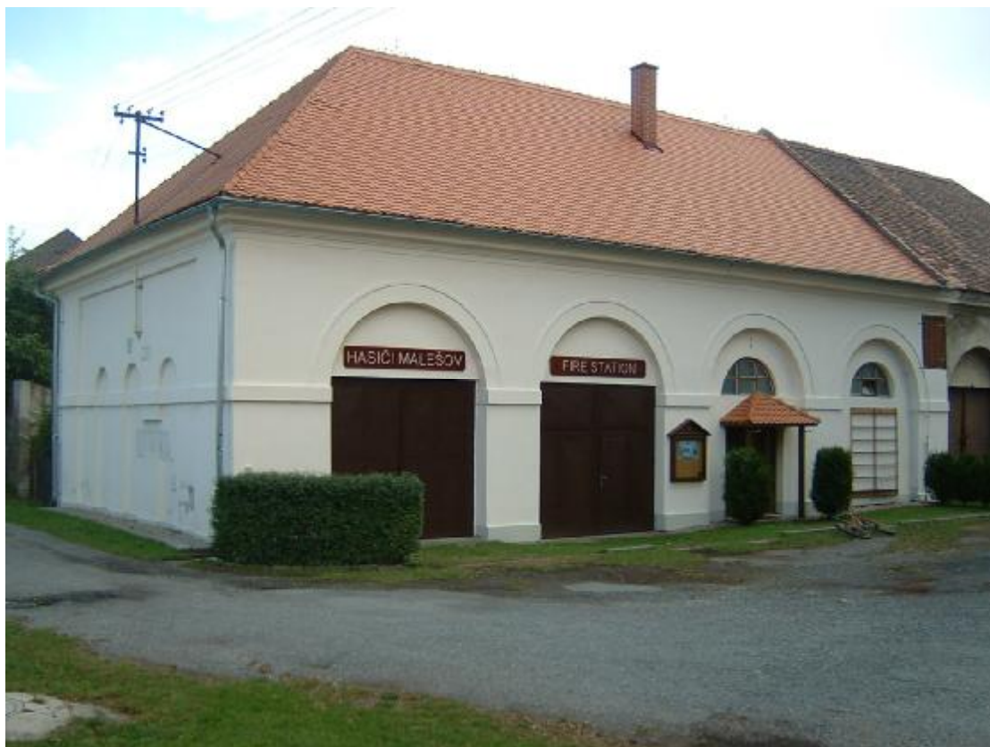
Hasičská zbrojnice (součást areálu zámku čp. 1)