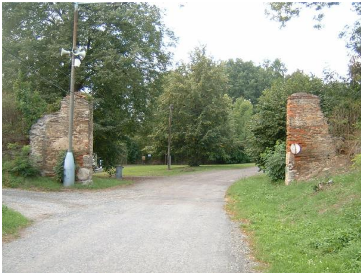
Vstupní brána do obce – pohled z obce ven

Současný stav je nevyhovující, stavba vyžaduje odbornou obnovu, je zahrnuta do anketního dotazníku pro rok 2016.