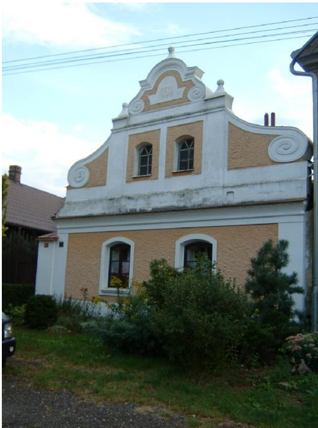
Dům čp. 52 Žižkovo náměstí

Dům čp. 52 naproti kostelu sv. Václava z konce 18. století je přízemní barokní stavba obdélného půdorysu orientovaná štítem kolmo k náměstí. Sedlová střecha je v průčelí převýšena velkým volutovým štítem s dvěma pilastry, vybíhající svými sloupovými hlavicemi nad štít. Vrcholový, bohatě profilovaný štítek je, jako hlavice pilastrů, ozdoben pískovcovými koulemi. Ve středu štítku jsou dvě půlkruhem zaklenutá okénka v obdélných vpadlinách. Čelní fasáda byla obnovena v roce 1991.