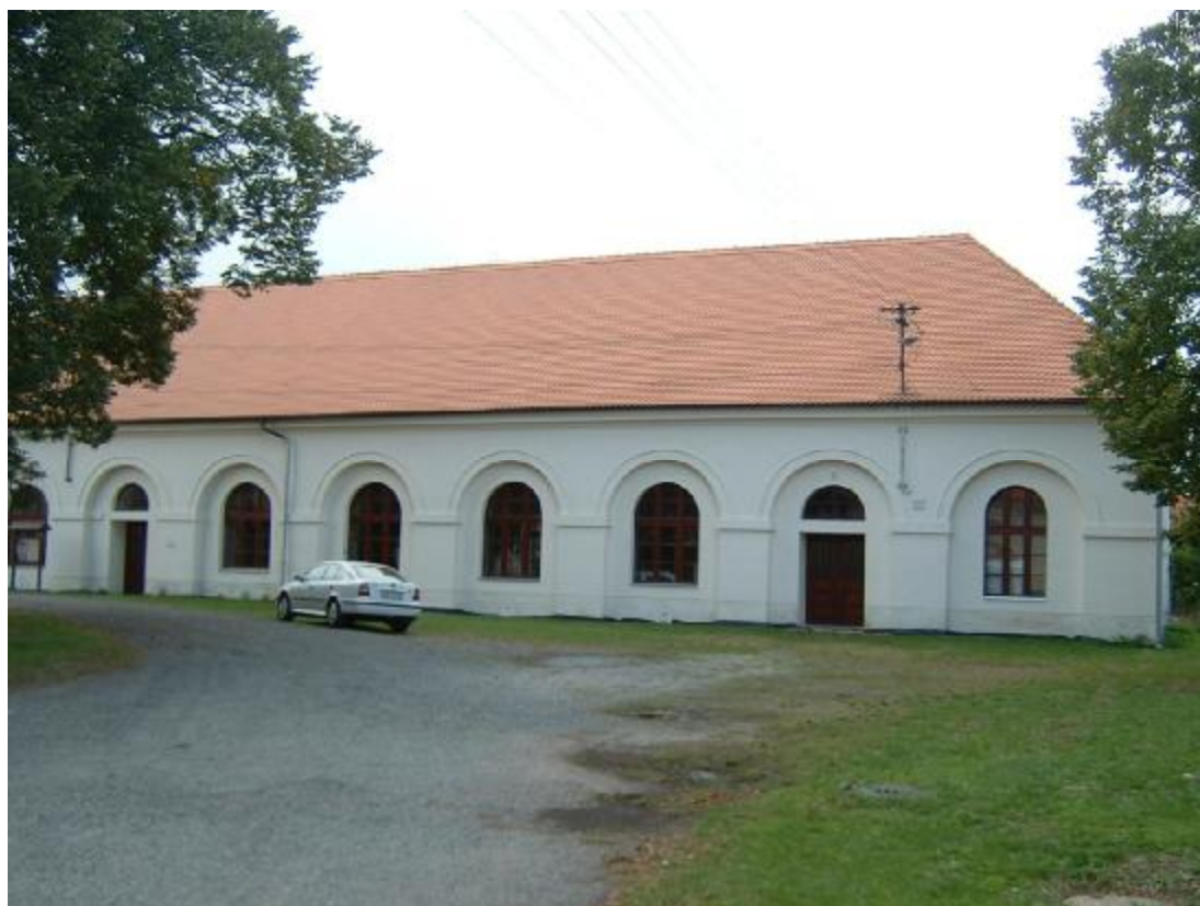
Budova tělocvičny ZŠ Malešov (součást areálu zámku čp. 1)