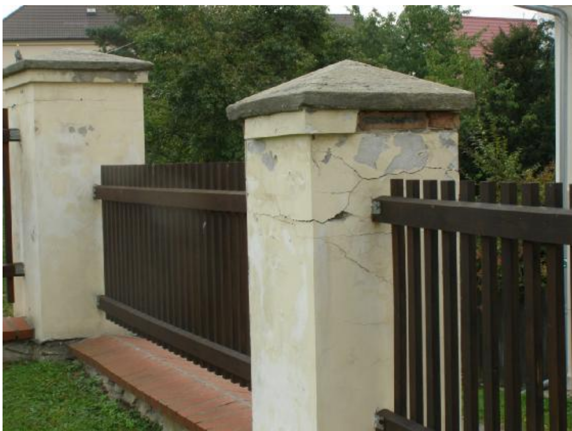
Pilíře oplocení areálu zámku čp. 1