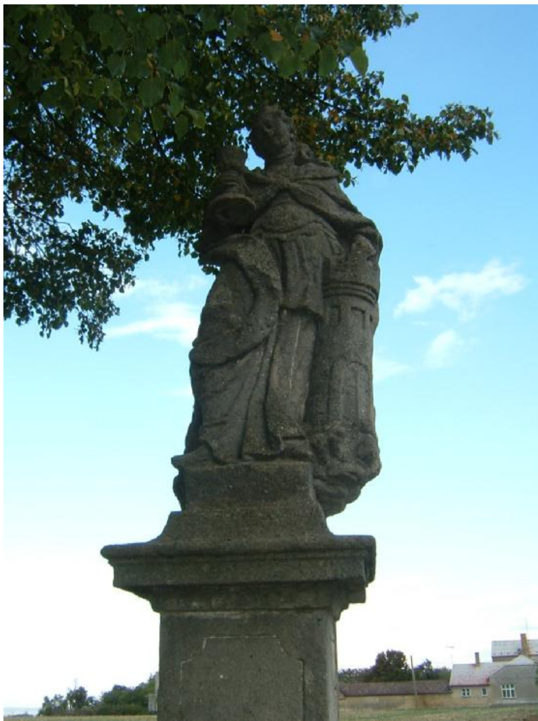
Socha sv. Panny Barbory (detail)