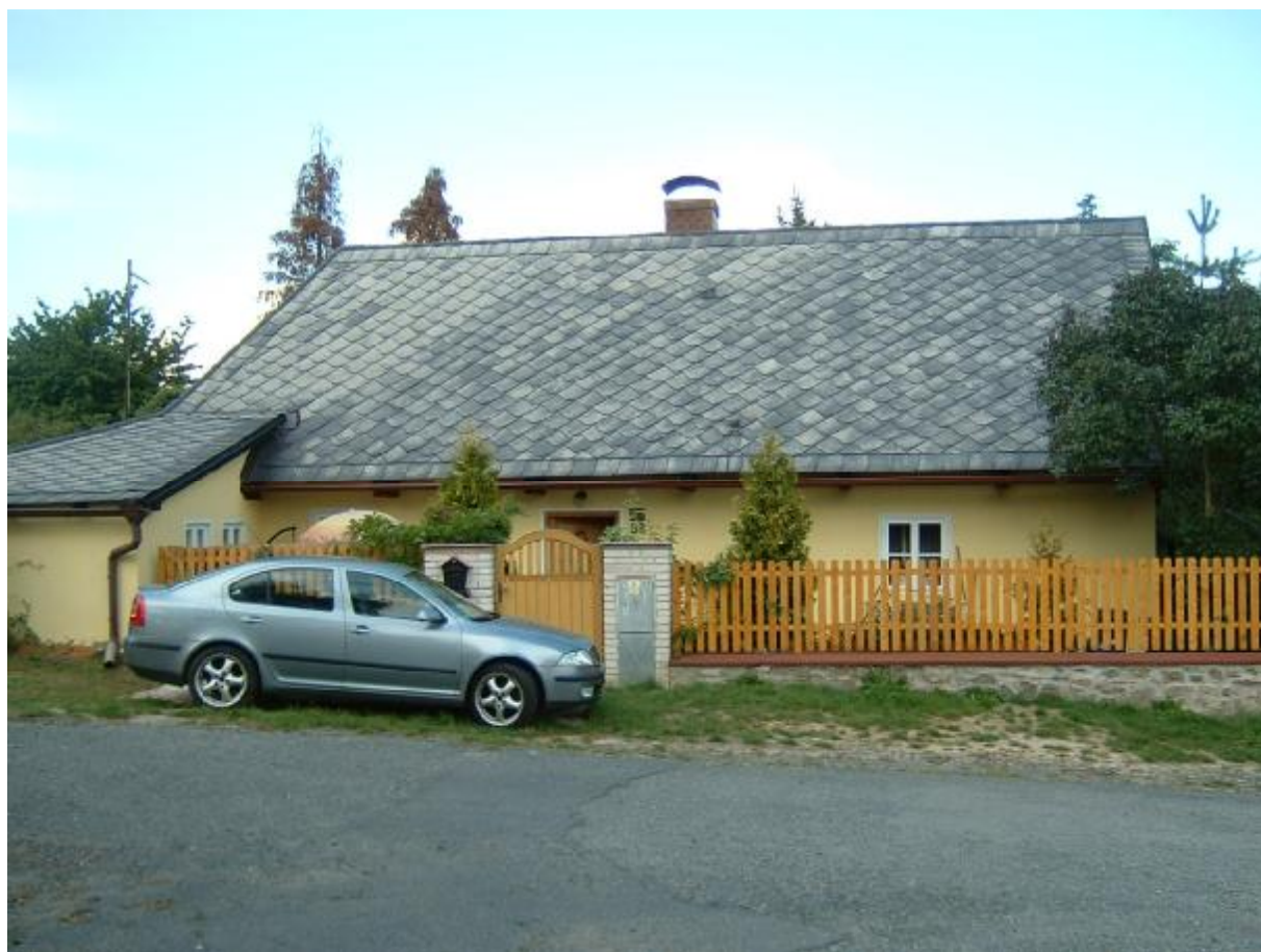
Venkovská usedlost čp. 88

Nízký obdélný zděný domek, který má na jihozápadním nároží malý přístavek, bokem otočený na jih k cestě a štítem na východ k sousední parcele. Střecha je nápadně vysoká, ukončená na západě strmou valbou a na východní straně dřevěným štítem. Krytina eternit, omítky hladké.