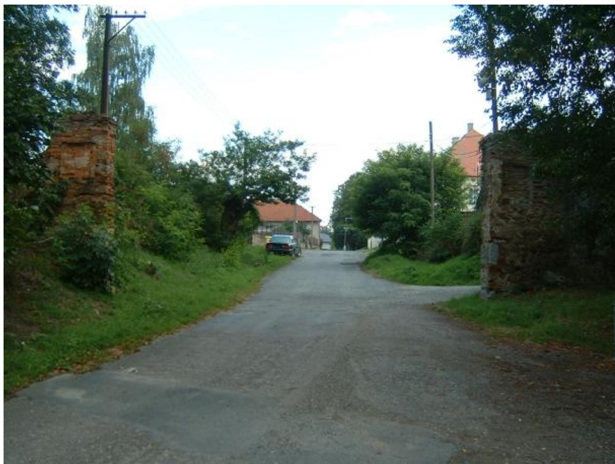
Vstupní brána do obce (celkový pohled)

Předpokládané náklady na obnovu jsou ve výši 350 000,- Kč.