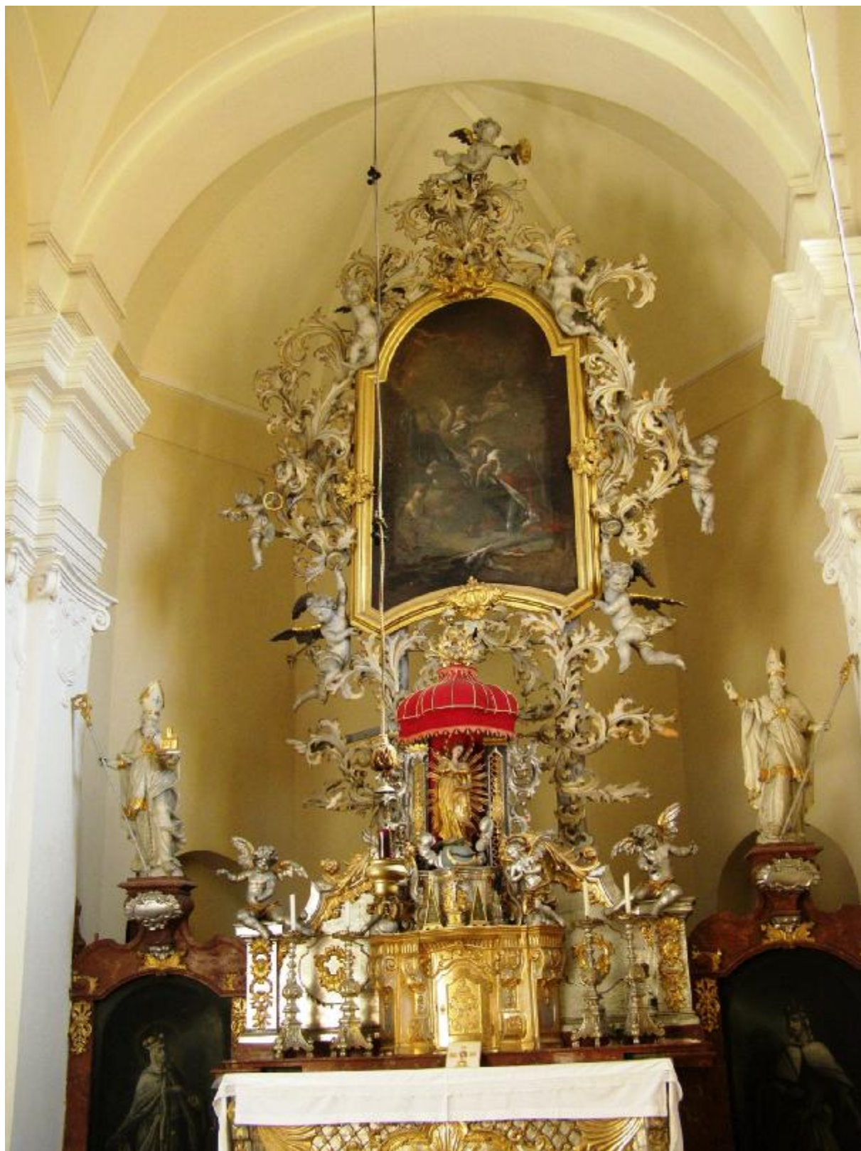
Hlavní oltář sv. Václava