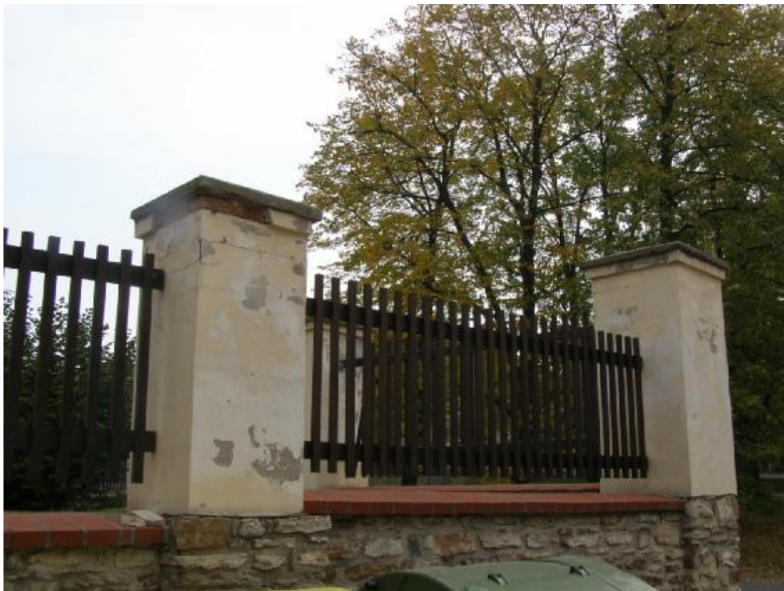
Pilíře oplocení areálu zámku čp. 1

Předpokládané náklady na obnovu jsou ve výši 250 000,- Kč.