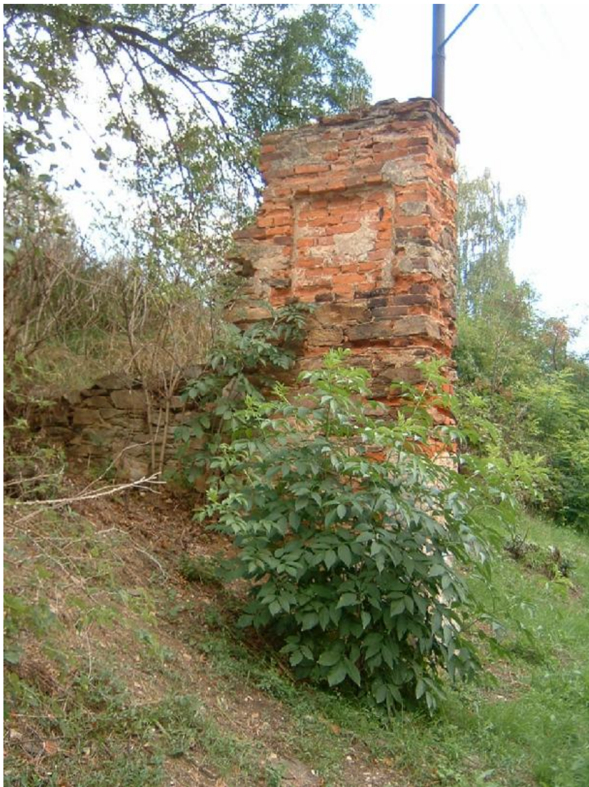
Vstupní brána do obce (detail – levý pilíř)