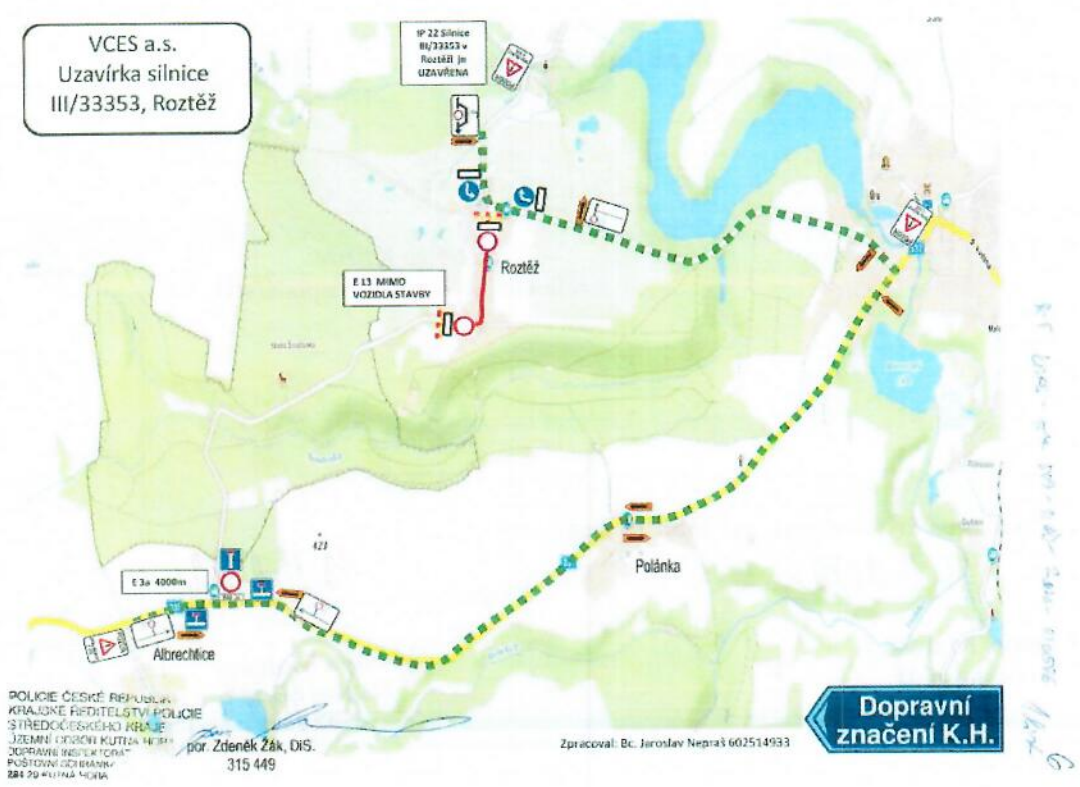
DIO 2 (kanalizace od 1.6.2022 do 30.4.2023)